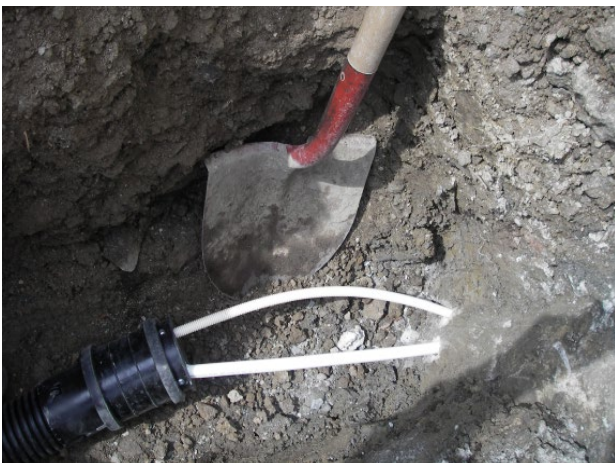
I NB21 er drenerørret avsnørt for å utnytte volumet i filteret og å redusere belastningen på kommunalt nett.

3. Bestem ønsket volum som skal holdes på overflata. Figur 1 viser 15-30 cm som maksimal vannhøyde, for å sikre at det ikke blir stående et permanent vannspeil. Arealet vil i praksis variere mellom 3–7 % av nedbørfeltet, avhengig av ønsket tilbakeholding (se faktaboksen). Detaljer kan leses i Paus og Braskerud (2013).