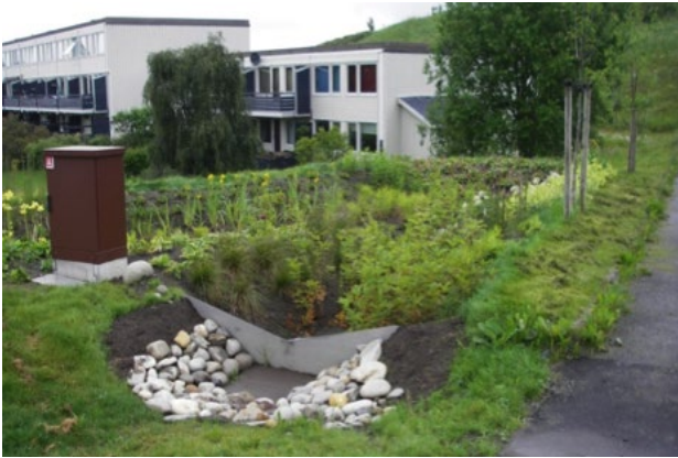
RIS har et lite sedimentasjonskammer ved innløpet for å lette vedlikeholdet av regnbedet.