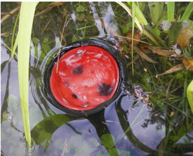
Overvann renner inn i drenerøråpningen i NB21 når overflatevolumet er fylt.