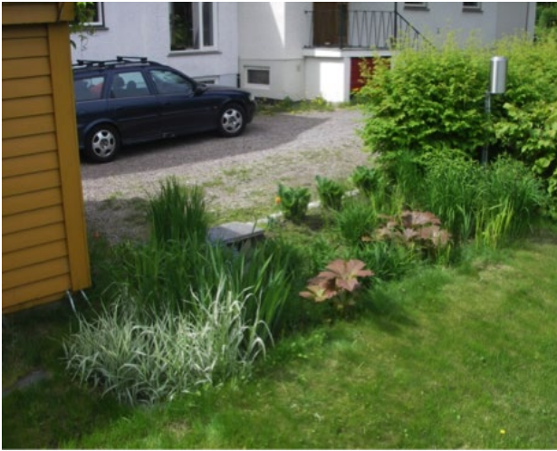
L34b ligger på sandig morene, og trenger derfor ingen drenering.