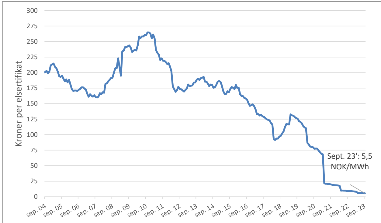
Figur 3: Volumveide registerpriser i elsertifikatregistrene NECS og Cesar [NOK]. Prisen gitt for juni 2023 er de volumveide gjennomsnittsprisene det foregående året (1. oktober 2022 til 30. september 2023). (oppdatert t.o.m. 1. oktober 2023).